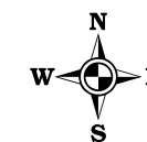
Planche 12 / 12